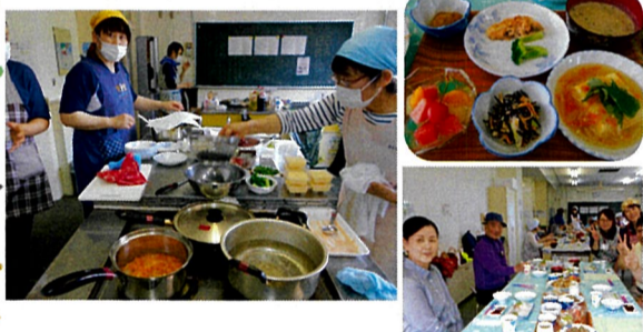
あわせて「試食会」も実施しました

管理栄養士作成の献立をヘルパーみんなで調理！ 皆さんに美味しい料理をお届けします。