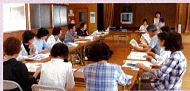
『健幸出前講座』の様子

高齢者のこと、福祉のこと、困った時は何でもご相談下さい。職員が訪問する事もできます。まずはお気軽にご相談を！