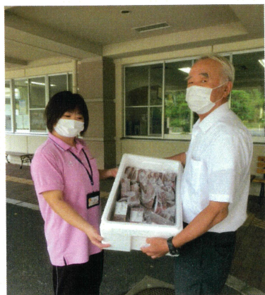
長門大津くじら食文化を継承する会様より