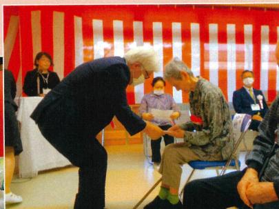
ゆもと苑・きららの里の様子