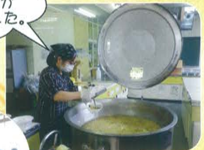
担当施設の調理員が腕を振った豚汁