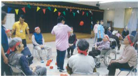
みんなで数を数えます〜 1・2・3・・・