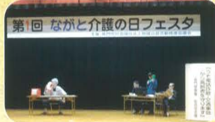
長門警察署による公開講座

繋がる・結ぶ・学ぶイベントとし、11月11日の介護の日に長門市中央公民館で開催されました。