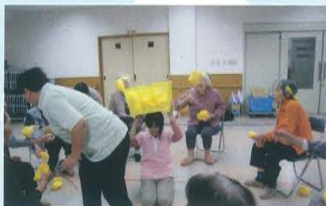
ヨイショ! なかなか入らんで〜!