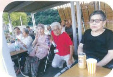
来年も是非お越しく下さい