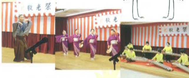
秀之の会様と清祥会様